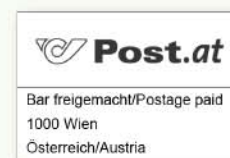
„Bar freigemacht“- Stempel

Für eilige Aussendungen kann ein Poststempel mitgedruckt werden. Der Versand dauert hier nur 1–2 Werktage und es müssen keine Vorgaben bei der Gestaltung Ihrer Postkarten berücksichtigt werden, da diese nicht maschinell bearbeitet werden ( erhöhte Versandkosten! ).