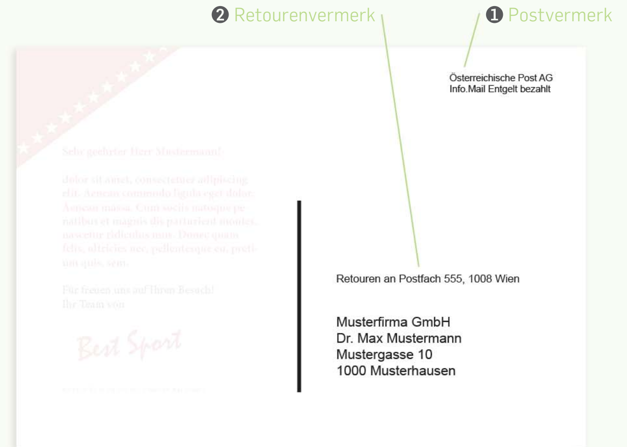
Beispiel für eine Postkartenrückseite in A6 (148,5x105mm) mit Info.Mail und Retourenvermerk.

* Bei weniger als 400 Stück ist jedenfalls das Entgelt für 400 Stück in der gleichen Gewichtsklasse zu entrichten.