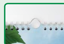
Wandkalender einseitig spiralisiert mit Aufhänger, Spiralisierung in weiß, schwarz oder silber