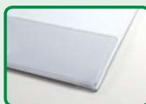
auch mit Flappe erhältlich