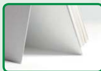
Tischkalender mit Standfuß aus Karton