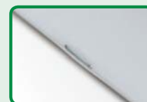
Broschürenkalender mit Broschürensattelheftung