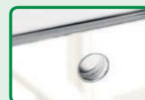
doppelseitiger Wandkalender mit Lochbohrung