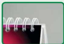
Tischkalender spiralisiert, zum einfachen Umblättern